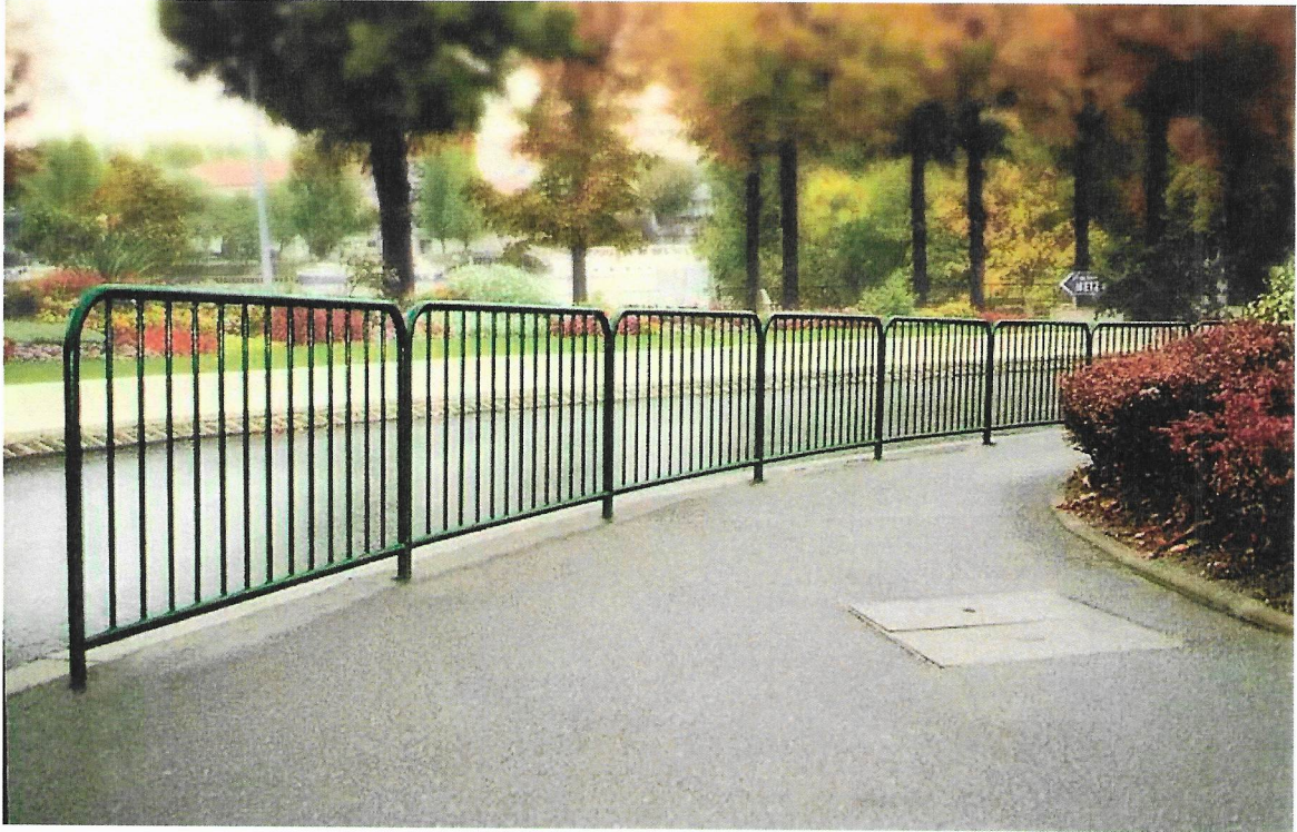
Bild 3 fester Zaun