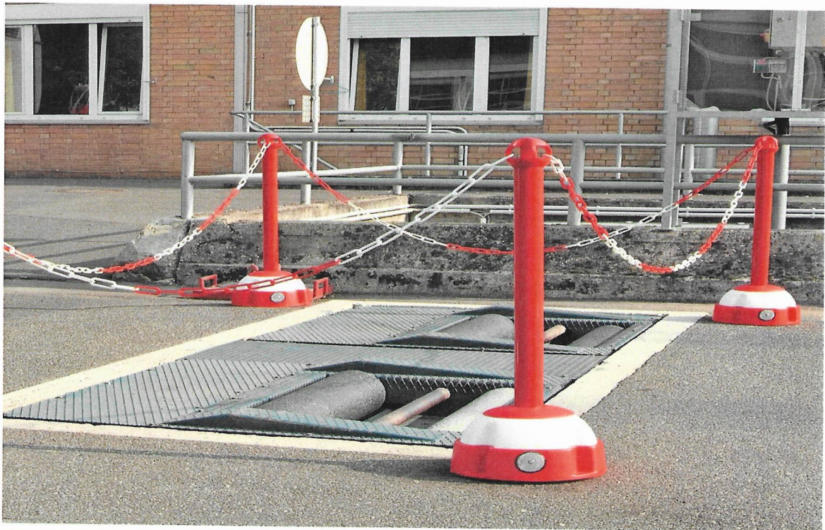
Bild 2 Ketten-Warnständer ARRE