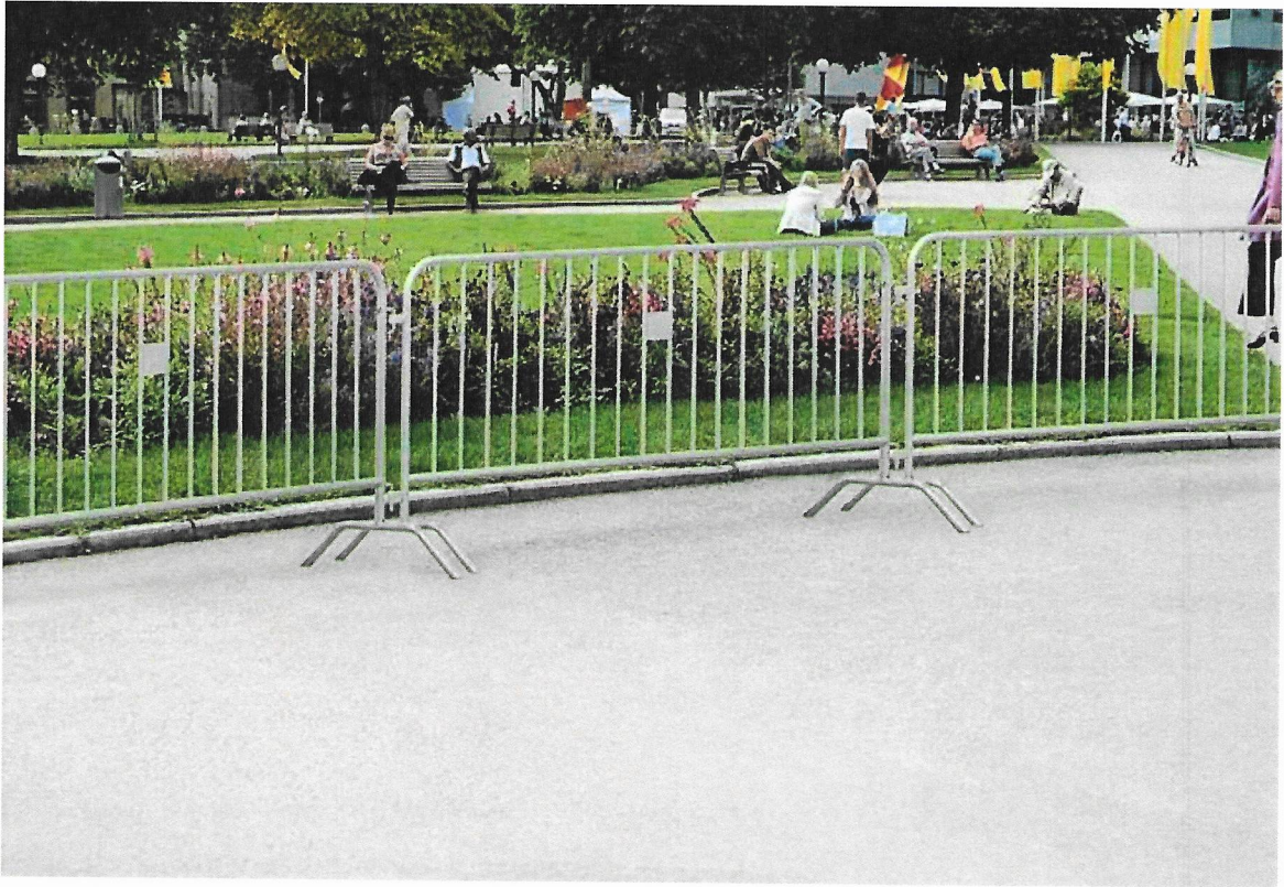
Bild 1 mobile Zäune