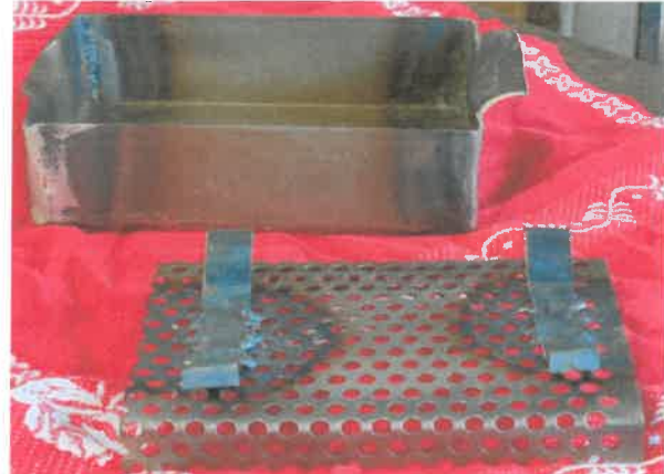
zu 7.1., zu 7.2.