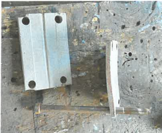
zu 6.1., zu 6.2., zu 6.3.