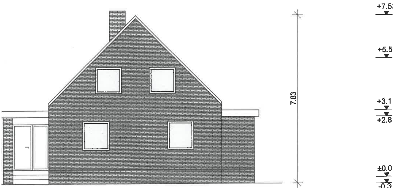
Ansicht West Bestand